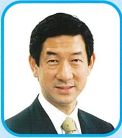
衆議院議員 伊藤 信太郎