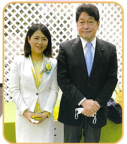
小野寺衆議院議員と一緒に