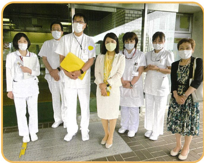
宮城県精神医療センター