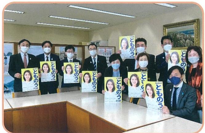
県議会議員自民党会派室訪問