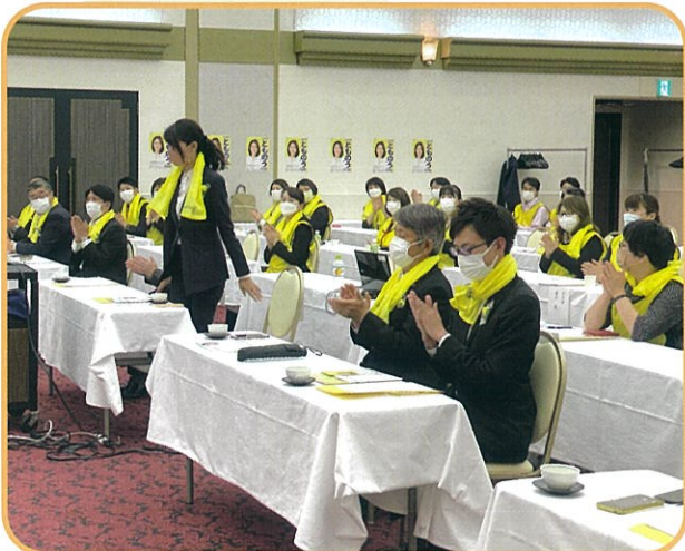
県議、仙台市議の参加