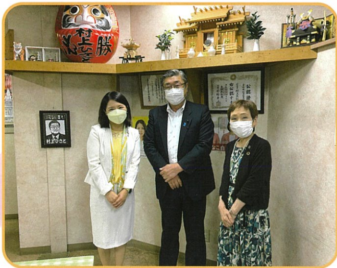
村上久仁県議事務所