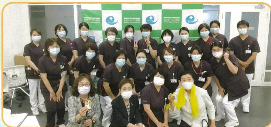
仙台オープン病院