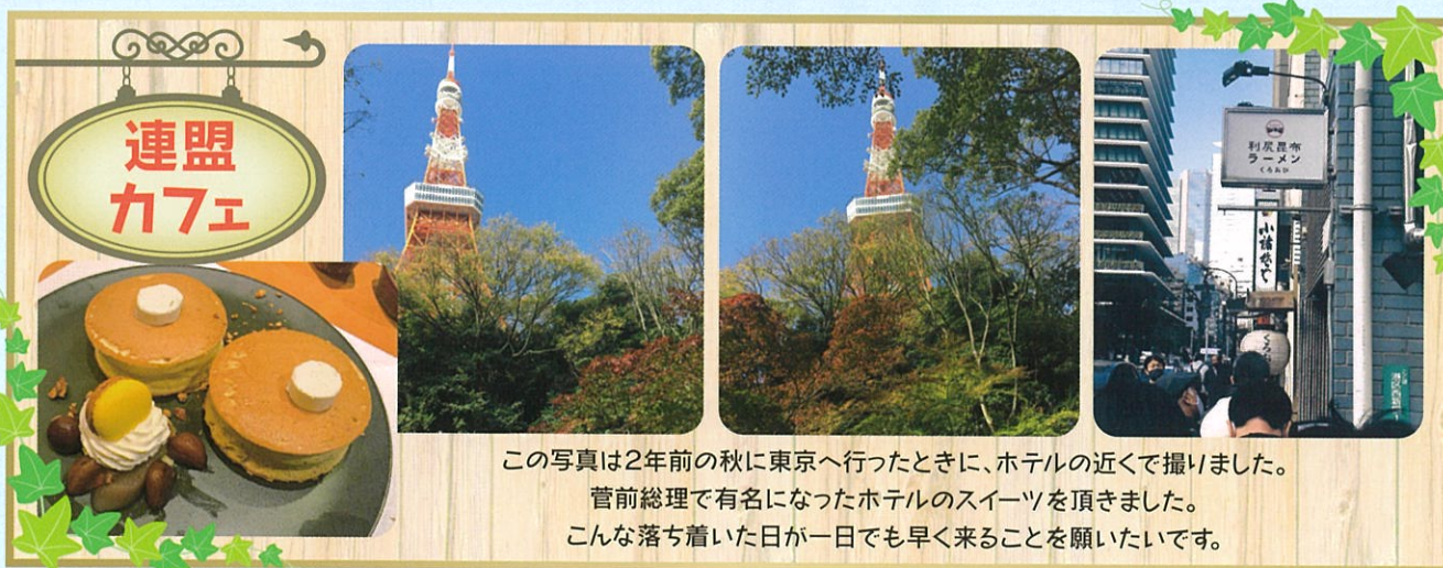
この写真は2年前の秋に東京へ行ったときに、ホテルの近くで撮りました。 菅前総理で有名になったホテルのスイーツを頂きました。 こんな落ち着いた日が一日でも早く来ることを願っています。

まだまだ不安が大きい状況ですが、そんな時だからこそ未来に向かって看護の力を発揮していきましょう。