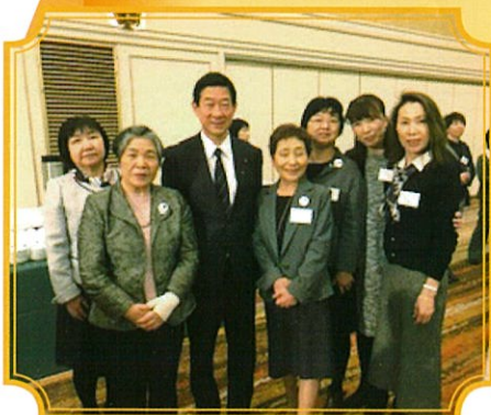
衆議院議員 伊藤信太郎先生と