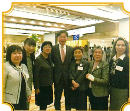
衆議院議員 秋葉賢也先生と