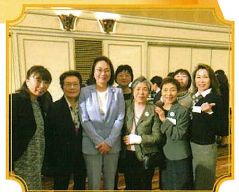
高階恵美子参議院議員と