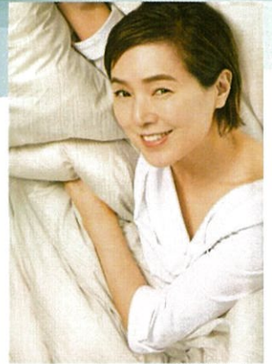
東洋羽毛イメージキャラクター 桃井かおりさん

TUK 東洋羽毛北部販売株式会社 仙台営業所 〒984-0032 宮城県仙台市若林区荒井一丁目29番地の13 7/11 0120-023-337 030-200121-1