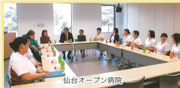
仙台オープン病院