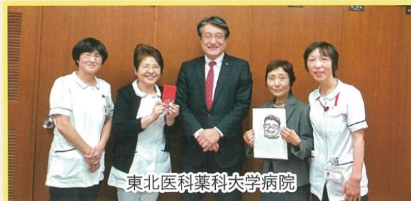
東北医科薬科大学病院